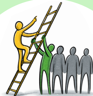
Illustration: Andreas Gärtner www.gaertner-illustrator.de

Gestaltung: Alexandra Hansmeier www.kommdesign-hansmeier.de